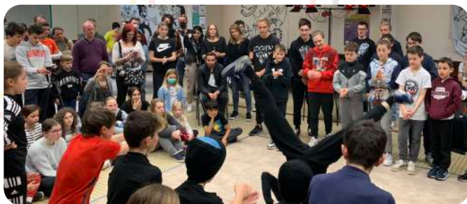
Tout au long de l'année

Perçue sur un même pied d'égalité, chaque expression entre dans les négociations de la mise en œuvre de projets co-construits avec les partenaires et les habitants.