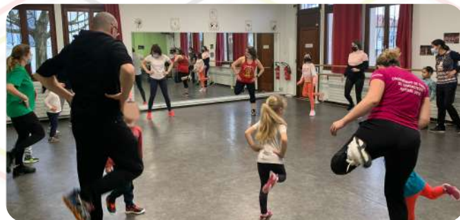
Et pendant les vacances scolaires

Des ateliers spécifiques parent/enfant :