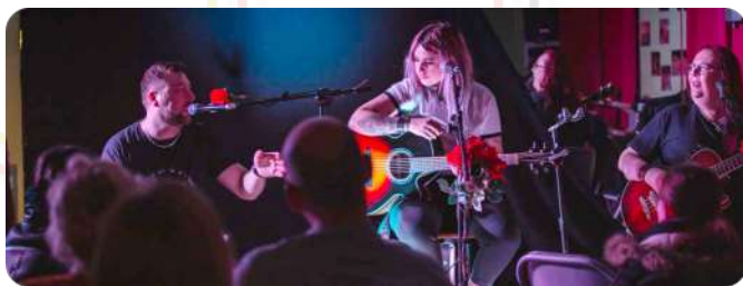
Autour de la scolarité